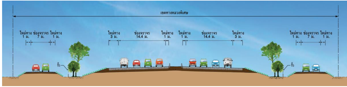
รูปที่ 7 ทางหลวงพิเศษระหว่างเมือง 8 ช่องจราจร และทางบริการ

5.1.4 รูปแบบทางหลวงยกระดับขนาด 6 ช่องจราจร : กำหนดไว้ในแนวเส้นทางโครงการช่วงประมาณ กม.17+900 ถึง กม.29+100 กำหนดรูปแบบทางหลวงยกระดับ เพื่อลดผลกระทบด้านการเวนคืนพื้นที่ชุมชน มีลักษณะเป็นทางยกระดับขนาด 6 ช่องจราจร (3 ช่องจราจรต่อทิศทาง) โดยใช้ช่วงที่แนวเส้นทางอยู่บนทางหลวงหมายเลข 331 จะดำเนินการก่อสร้างโดยใช้เขตทางเดิมของทางหลวงหมายเลข 331 เป็นหลัก กว้างช่องจราจรละ 3.6 เมตร ไหล่ทางด้านในกว้าง 1 เมตร ไหล่ทางด้านนอกกว้าง 3 เมตร มีเกาะกลางกั้นด้วยกำแพงคอนกรีต (Concrete Barrier) (ดังรูปที่ 8)